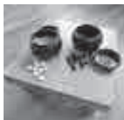
囲碁や将棋もあります!!