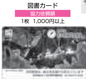
図書カード 協力依頼額 1枚 1,000円以上