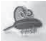
ピンバッジ 協力依頼額 1個 500円以上

戸別募金では、各区を通じ、住民のみなさまにご協力いただきました。ありがとうございます。引き続き、募金を募集しております。クオカードや図書カード、ピンバッジの購入による募金も社協窓口で受け付けています。