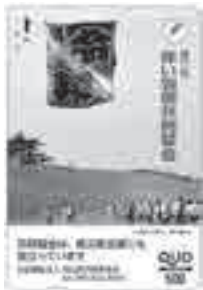
クオカード 協力依頼額 1枚 1,000円以上