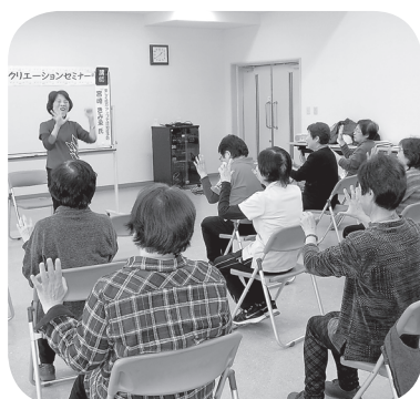
前回のセミナーより