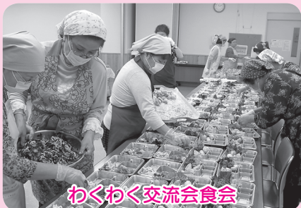
わくわく交流会食会