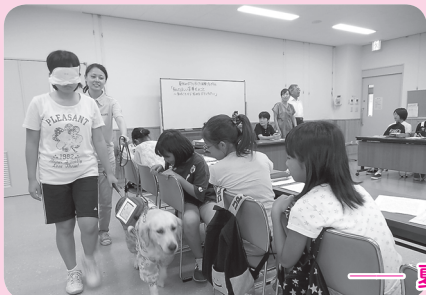
— 夏休みボランティア体験プログラム —