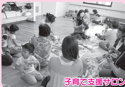
子育て支援サロン“おばあちゃんち”