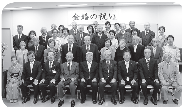
平成28年度「金婚の祝い」より