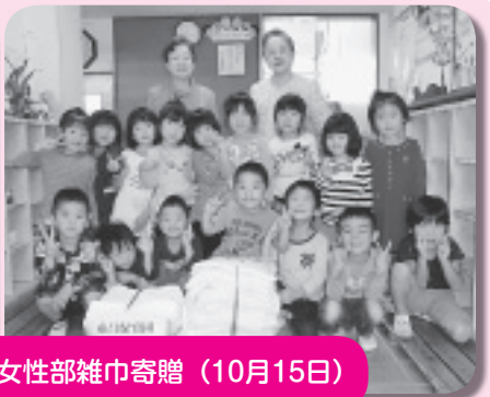
老人クラブ女性部雑巾寄贈（10月15日）