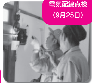
電気配線点検 （9月25日）