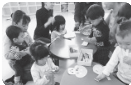
季節の製作をして楽しんだり…