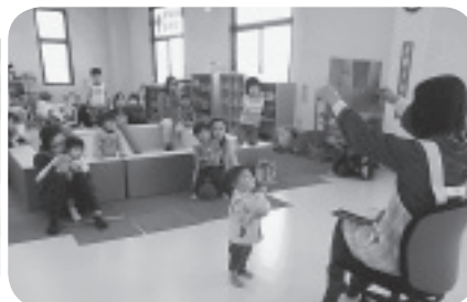
色々な絵本の読み聞かせをしたり…