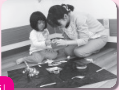
子育て支援サロン「おばあちゃんち」 オータムスクール（10月26日）