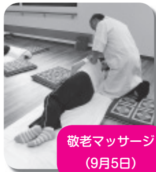
敬老マッサージ （9月5日）