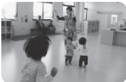
大好きな体操で元気に体を動かしたり…

毎週 火・木・土 の11:00からは、「わくわくタイム」という時間を設けて、親子のふれあいを楽しんでいます。