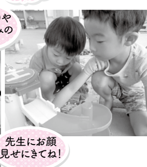
先生にお顔 見せにきてね!