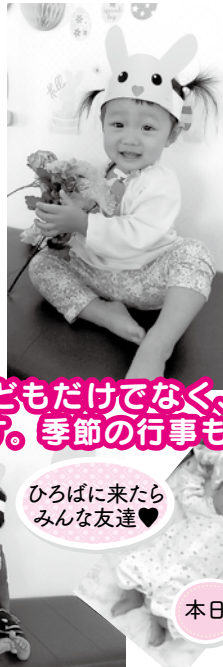
ひろばに来たら みんな友達♡