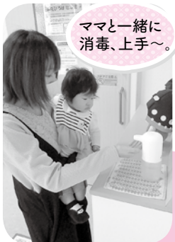
ママと一緒に 消毒、上手〜。

親子のいごいの場、子どもだけでなく、パパやママ交流の場としてもご利用いただいています。季節の行事もたくさん!