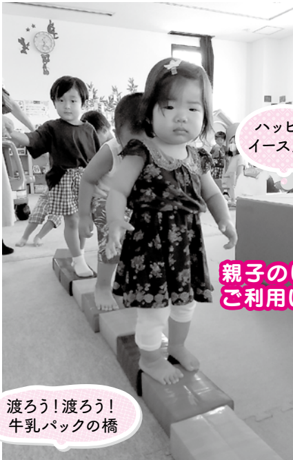
渡ろう! 渡ろう! 牛乳パックの橋