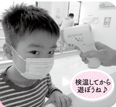
検温してから 遊ぼうね♪