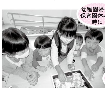
幼稚園帰りや 保育園休みの 時に