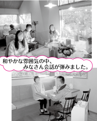
和やかな雰囲気の中、みなさん会話が弾みました。