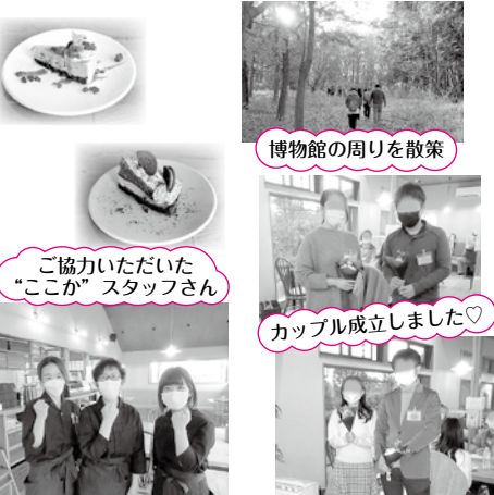
博物館の周りを散策