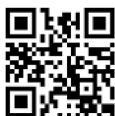
嵐丸ひろば ホームページ