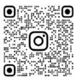
⑧RANMARU_HIROBA 嵐丸ひろば インスタグラム

子育てひろばと一時保育で親子の健やかな成長を応援します。イベント情報や一時保育の空き状況はホームページやインスタグラムで発信しています。