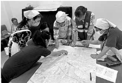
日赤嵐山町分区分

災害図上訓練「DIG」を体験しました。身近に潜んでいる災害の危険性をみんなでも考えました。