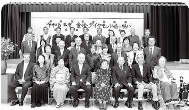
令和6年度「金婚・ダイヤモンド婚の祝い」より