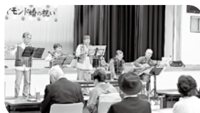
お祝いの余興演奏