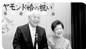
ダイヤモンド婚代表あいさつ